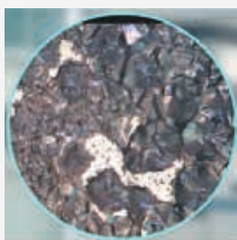
Placas Drive+ Nanotecnología

Por su parte, las rejillas de metal expandido con aleación de calcio-calcio están introducidas en un sobre separador de tipo bolsillo microperforado que permite el acceso del electrolito y asegura el mayor rendimiento y conductividad eléctrica, aportando una mayor potencia de arranque alcanzando prestaciones de máximo nivel.